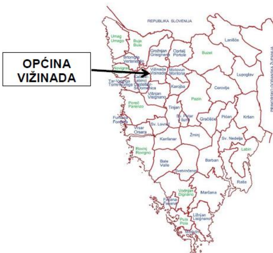
Slika 1. Položaj Općine Vižinada u Istarskoj županiji

Površina Općine Vižinada iznosi 36,10 km 2 , odnosno 1,28% ukupne površine Županije koja iznosi 2 813 km 2 . U okviru Istarske županije Općina Vižinada spada u red malih općina. Naselje Vižinada je administrativno središte općine Vižinada.