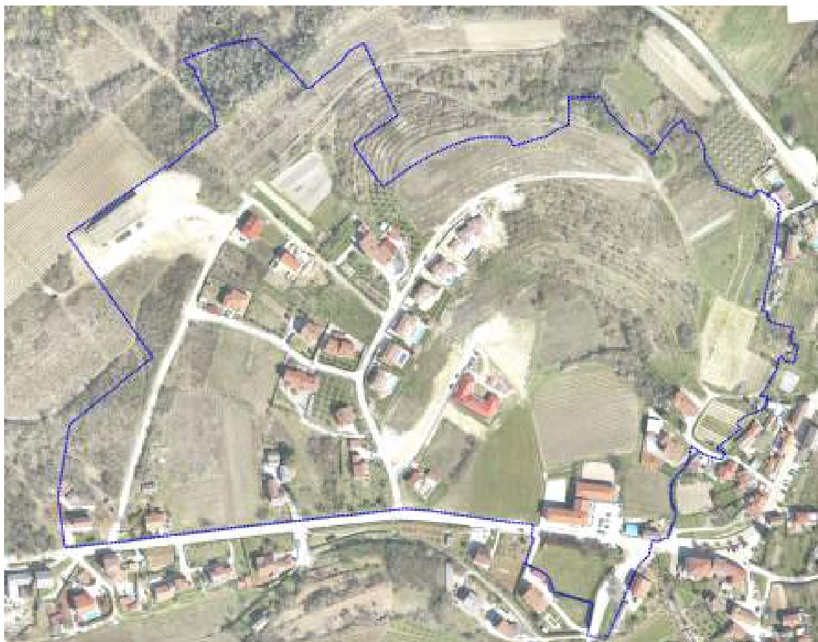
SLIKA 1. – područje obuhvata Plana

Područje obuhvata Urbanističkog plana uređenja Vižinada sjever obuhvaća sjeverni dio građevinskog područja naselja Vižinada te izdvojenu zonu sportsko rekreacijske namjene u sklopu građevinskog područja naselja ukupne površine oko 17 ha.